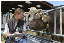
Produits de soins pour animaux et produits vétérinaires