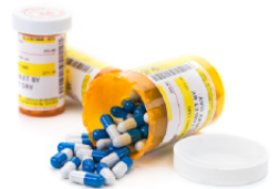
Produits pharmaceutiques, cosmétiques et d'analyse médicale

Réduisez la complexité et réduisez les coûts