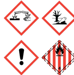
Produits chimiques GHS / CLP