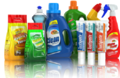
Produits d'entretien et ménagers